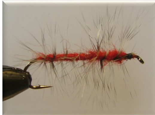
Hans Janssen (Dubble Shrimp 5 Canada)