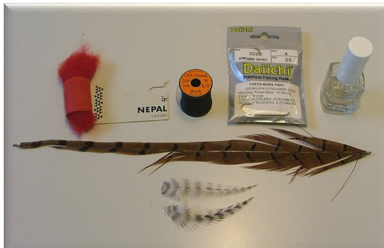
Hans Janssen (Dubble Shrimp 5 Canada)