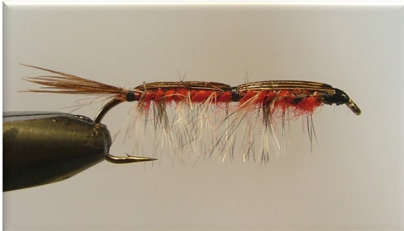
Hans Janssen (Dubble Shrimp 5 Canada)