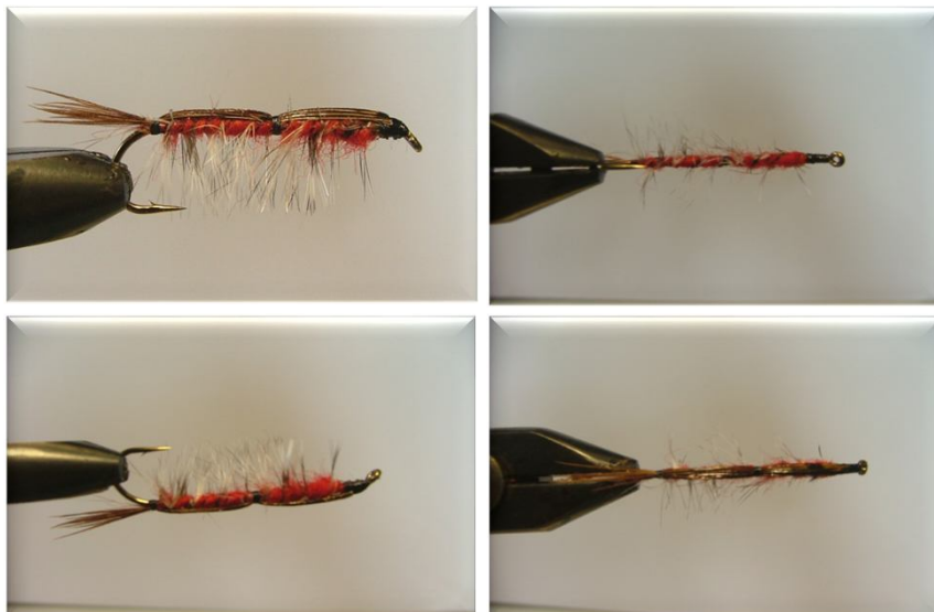
Hans Janssen (Dubble Shrimp 5 Canada)