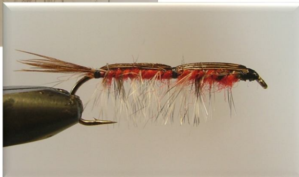
Hans Janssen (Dubble Shrimp 5 Canada)