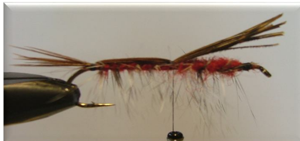
Hans Janssen (Dubble Shrimp 5 Canada)